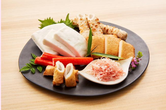
練り製品盛り合わせ はんぺん (左上)